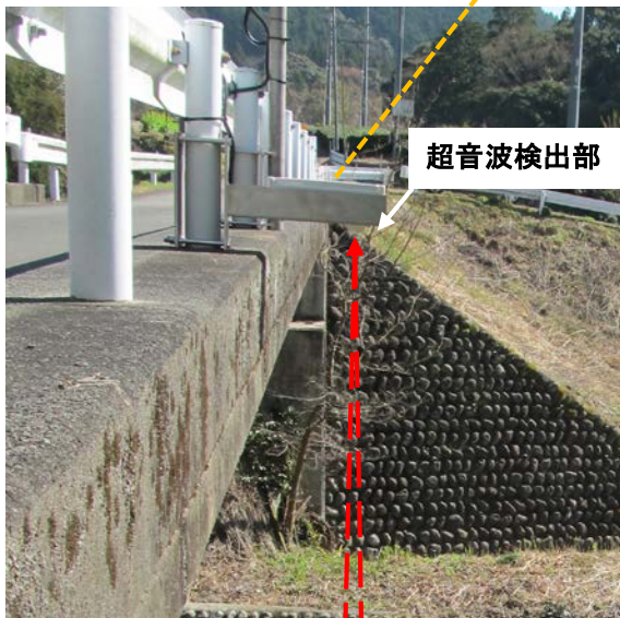
気象庁気象研究所殿納入