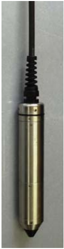
耐凍結圧力式水位検出器